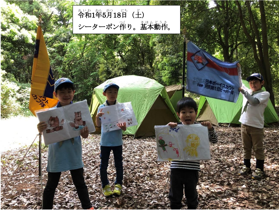
れい わ ねん が つ にち ど 令和1年5月18日 (土) シーターポン つく 作り。基本 きほん 動作 どうさ 。