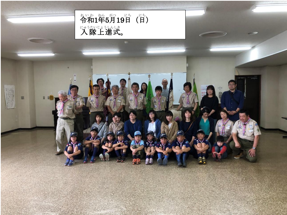
れい わ ねん が つ にち にち 令和1年5月19日 (日) にゅうたいじょうしんしき 入隊 にゅうたい 上進 じょうしん 式 しき 。